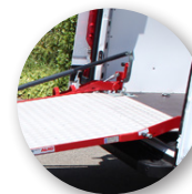
Bewegliche Übergangsklappe zur Ladefläche