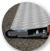
Rad für leichtes Ausklappen