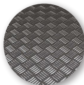
Trittfläche aus rutschfestem Alu-Riffelblech