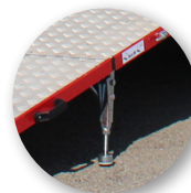
Einstellbare, selbst positionierende Füße